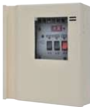
▲ 鐵捲門控制盤 型號：YH-02312RS 認可編號：AR-A109005