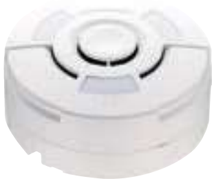
一氧化碳(CO)檢知器 型號: NDKA1