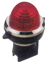
幫浦啓動燈 30mm/110V/220V/24V 25mm/110V/220V/24V