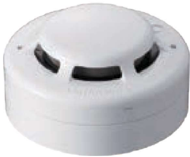
定址式定溫式探測器