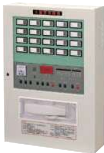
▲ 型號：YH-8401 認可編號：AR-A9801