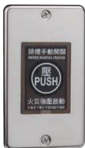
排煙手動開關(不鏽鋼) 型號：SH-48 產品編號：CC702