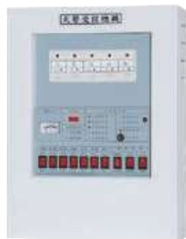
▲ 型號：:CM-P1 認可編號：AR-A106003