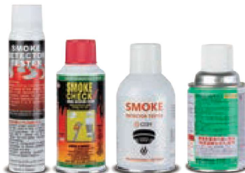
檢測液 日本/美國/台灣