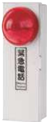
緊急電話啟動裝置