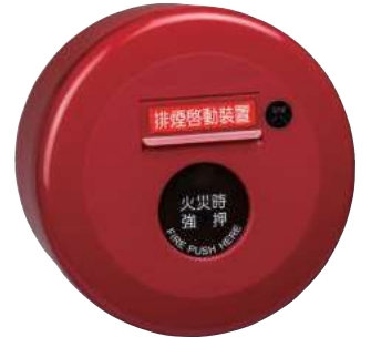
排煙手動啓動裝置 型號：CM-FP1(防火 ABS)