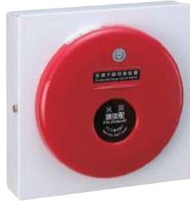
排煙手動啓動裝置 型號：SH-47(鐵殼烤漆)