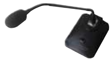
音樂鈴前後奏麥克風