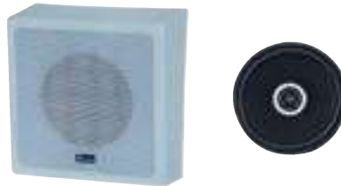
YSP-610AS 8英寸同軸二音路壁掛式喇叭