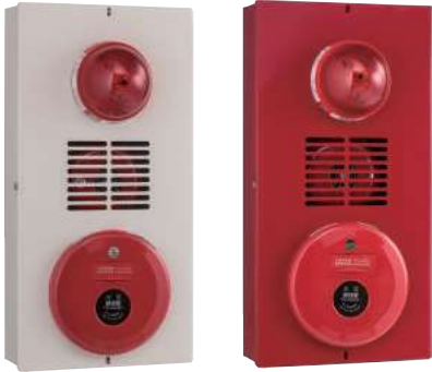
綜合盤(埋入式/掛壁式) 箱體：寬20cmx深7.5cmx長40cm