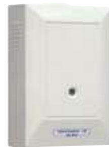
差動式分布型 型號: DHA-2L (FD-A103008)