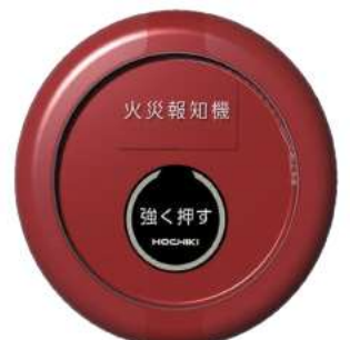
定址式發信機 型號：PRI-1