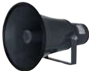
YSP-832E 8英寸指向性防水號角喇叭