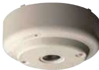
紅外線火焰探測器 型號: DRD-E (FD-A10213)