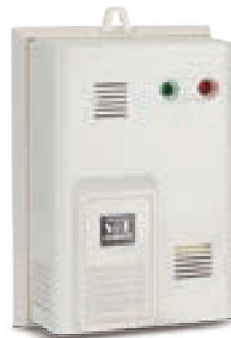
瓦斯警報器 型號: JIC-678A(壁掛)