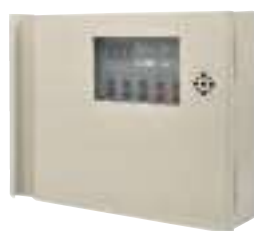
▲ 鐵捲門控制盤 (附電池) 型號：YH-02312 認可編號：AR-A109004