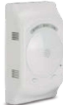
一氧化碳警報器 型號: ST-710