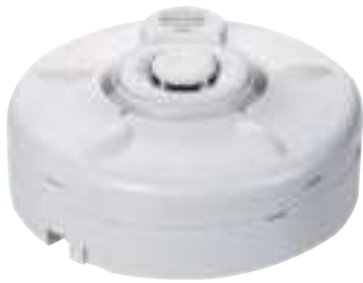
瓦斯漏氣檢知器 (消防署認證) 型號: AH-0822